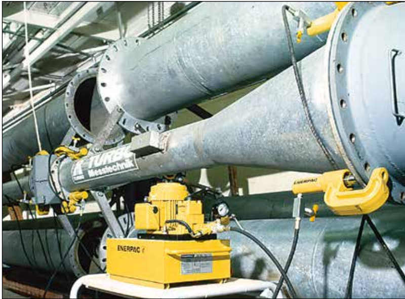
▲ Un ejemplo perfecto de la fuerza y la versatilidad de las mordazas Enerpac en C A-220.