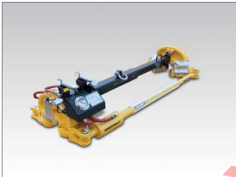
▼ Foto: Estiradores hidráulicos de riel RP120BP